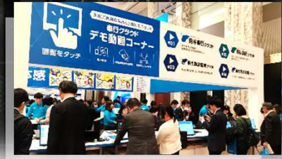
※写真は昨年の様様です。